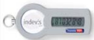
Abb. 1: indevi:s RSA Token

Jede Art von Bedruckung mit Ihrem Logo ist möglich. Hochwertige Drucktechniken sind die Basis für Ihr Logo. Eine starke Harzschicht schützt gegen äußerliche Einflüsse. Sie gibt Ihrem Logo Brillanz und einen verblüffenden 3D-Effekt - genau so wie auf dem original RSA Token mit RSA Logo: